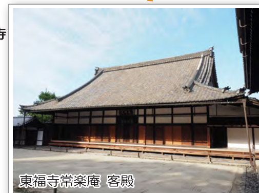
東福寺常楽庵 客殿